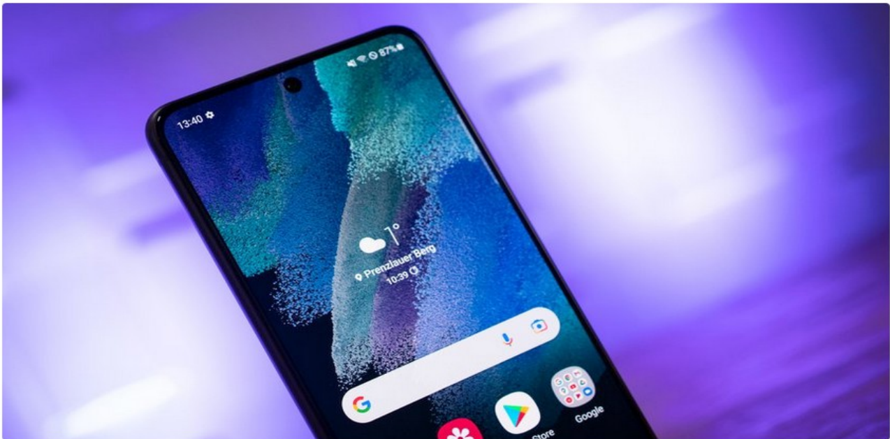
Samsung hat eine Funktion integriert, mit der ihr euer Smartphone überprüfen könnt.

Samsung-Smartphones gelten als sehr zuverlässig. Doch es kann immer mal passieren, dass es zu Problemen kommt. Bevor ihr euch an den Support von Samsung wendet, könnt ihr selbst eine Diagnose durchführen. Dafür wurde eine Funktion in die Smartphones integriert.