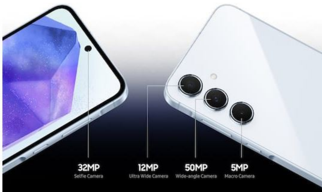
Die Kameras des Galaxy A55 Samsung, @evleaks

Brancheninsider Evan Blass versorgt seine Abonnenten mit einer großen Menge Pressmaterial des Galaxy A55 und Galaxy A35. Die durchgesickerten Werbefotos scheinen von Samsung selbst zu stammen. Beide Mittelklasse-Smartphones besitzen einen hochwertigen Aluminiumrahmen und einen 5000 mAh starken Akku. Der Hersteller mag es bunt und spendiert neben den Gehäusefarben Schwarz und Weiß eine gelbe und eine pastellfarbene Edition. Die Vorstellung erfolgt schon in wenigen Tagen. Samsung hat ein Event zur neuen A-Serie für den 11. März angekündigt.