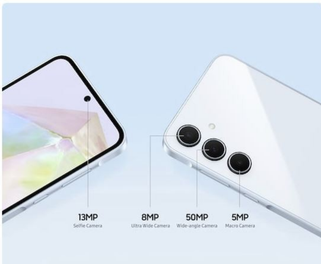
Kameras des Galaxy A35 Samsung, @evleaks

Beim Werbematerial des Galaxy A55 gibt es einen Verweis auf ein augenschonendes Display. Wenig überraschend handelt es sich sowohl bei der Anzeige des Galaxy A55 als auch jener des Galaxy A35 um ein OLED-Panel. In einem weiteren Foto deutet Samsung an, dass man mit einer Akkuladung des Galaxy A55 mühelos einen Tag übersteht. Selfie-Fotografen finden beim Galaxy A55 zudem eine höher aufgelöste Frontkamera (32 MP) als beim Galaxy A35 (13 MP) vor. Einen Staub- und Wasserschutz wird das Duo ebenfalls zu bieten haben.